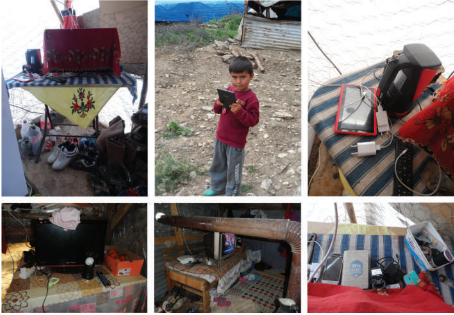
Resim 5. Çadırlarda televizyon, tablet, telefon ve kablolar