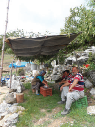
Resim 4. Plastik kasaların köşk oturma birimlerine dönüşmesi

Köşk dedikleri bu yapı ise çadırın çok yakına kurulmuş bir çardak gibidir (Resim 4). Ancak genellikle topraktan biraz yukarıda oturmak için tahta parçalarından çatma zemin kurulur. Üzerine minder atılır ve kilim serilir. Yerleşik Yörüklerde oldukça yaygın olan bu oluşum, konargöçerlerde görülmez. Yarı göçerlerin ise, içinde eşyalarını taşıdıkları plastik kasaları köşkte masa ve sandalye olarak kullanılarak, onlara ikincil bir fonksiyon kazandırdıkları görülmektedir. Bu kasalar, daha basit bir hali ile Resim 4’te sol köşede görülen kütük ile aynı işlevi görür. Ancak fonksiyon alanı kütükten çok daha geniştir. Yağmurdan etkilenmez ve güneş altında uzun süre dayanır.