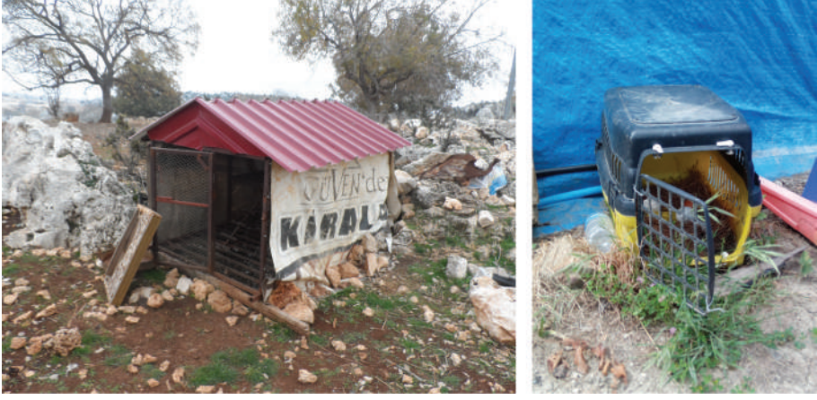
Resim 3. Tavuk, horoz, hindi kafesi ve kedi taşıma çantasında yumurtalar

çözümün değerlerinin, en azından bir parçasını bile taşımadan yerini alamaz. Nesnelere, bu değişimler sonucu, faydacıl nitelikleri ya da fonksiyonellikleri ile değil yeni kazandığı anlamlar sayesinde dönüşmüşlerdir. Nesnelere, sergiledikleri işlevlerle sınırlı değildir (Baudrillard, 2016) ve her şeyden öte, yaşam tarzı ile ilgili ipuçları ve sembolik işaretler taşırlar.