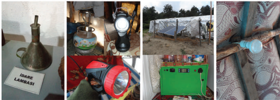
Resim 2. Aydınlatma: İdare lambasının yerini lüks, fener, radyolu ışıldak veya güneş enerjisi panelleri sayesinde ampullerin alması

Daha önceleri konargöçer Yörükler aydınlatma ürünü olarak minimal, taşınabilir, malzemesinden dolayı yolculuğa dayanıklı, üretimi kolay ve fonksiyonelliğinin ön planda olduğu idare lambalarını kullanıyorlardı (Resim 2). Bu lambalar, yakıt problemi ve yaşanan endüstriyel gelişmelere direnememişlerdir. Öncelikle çadırın iç aydınlatmasında lüksten yararlanmışsa da o da tüplü olması ve taşınabilirliğinin az, tehlikesinin yüksek olması nedenleriyle yerini el fenerlerine ve radyolu ışıldaklara bırakmıştır. Bu seçimlerde taşınabilirliğin yanı sıra çadır hayatına yeni bir eğlence alternatifini sunulması da etkili olmuştur. Radyo, Aksoy'un (2012) da belirttiği gibi hem hava tahminleri hem de dinlenme saatleri için bir çözüm ol-